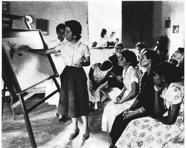
Les mouches sont dangereuses. Éducation sanitaire au Brésil à l'aide du flannelgraphe.