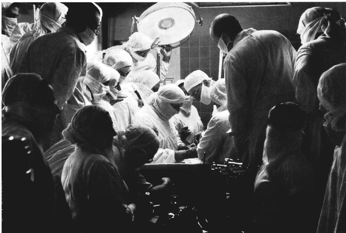
Un membre d'une mission d'enseignement médical fait une démonstration chirurgicale en Égypte.