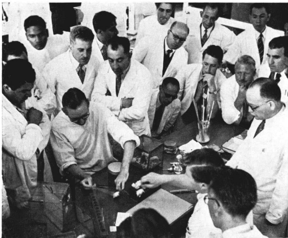
Conférence de Coonoor sur la rage (1952).