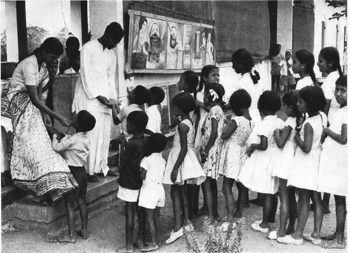
Dans une école rurale de Ceylan : propreté du visage et des mains.