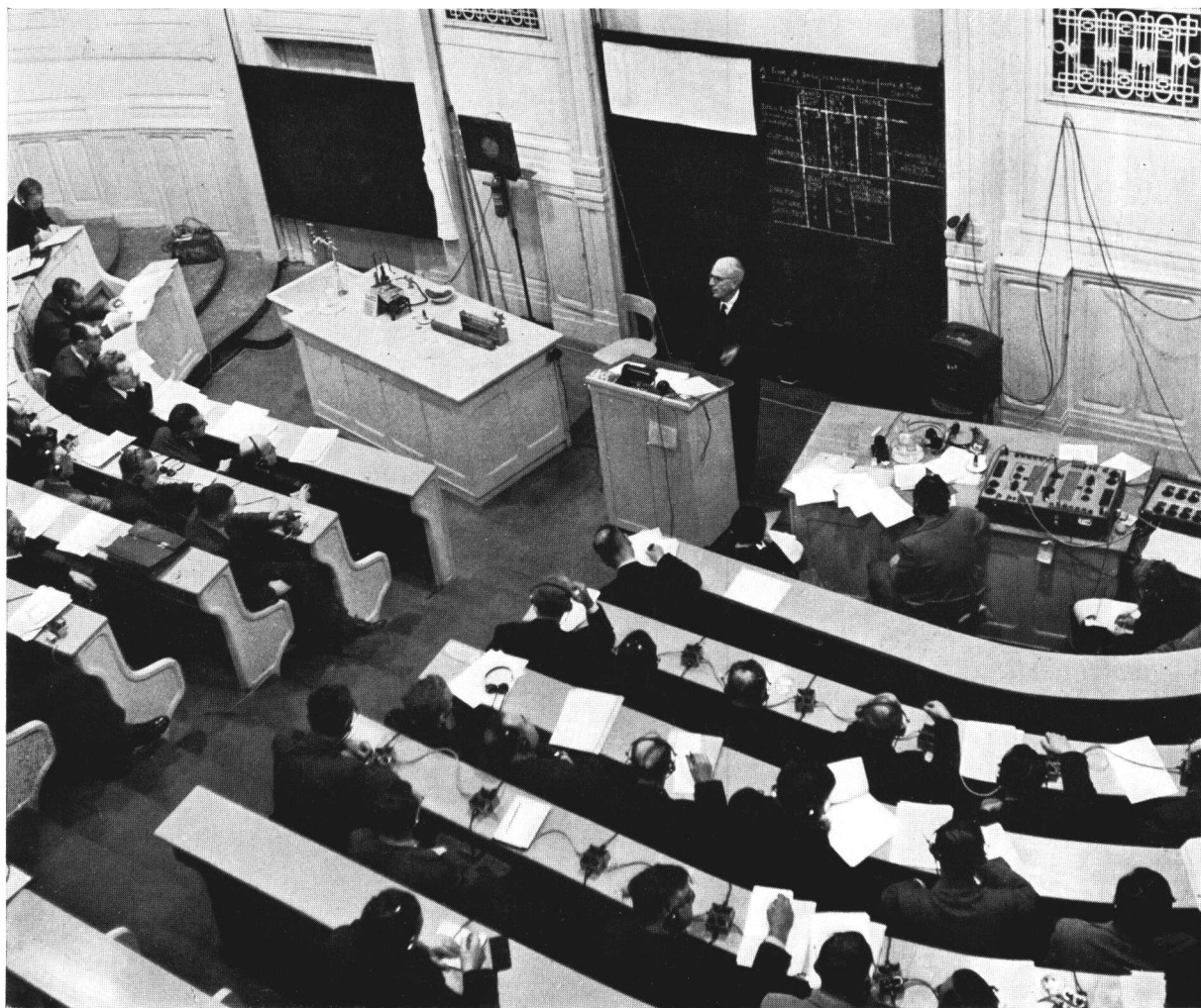
Séminaire FAO/OMS sur les zoonoses (Vienne, 1952).